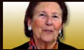
Élisabeth du Réau, elle nous rappelle l'histoire de la construction européenne.