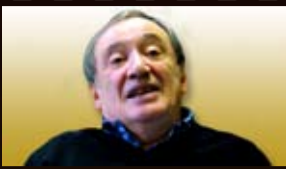
Gilles Veistein, historien du Collège de France raconte l'histoire de l'Empire ottoman.