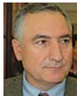
* Haydar Çakmak