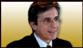
Ersin Özince, PDG de İş Bankası, la plus grande banque de Turquie, commente la crise économique.