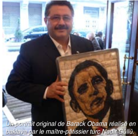
Un portrait original de Barack Obama réalisé en baklava par le maître-pâtissier turc Nadir Güllü.

les problèmes avec la région et son esprit de leadership collectif très efficace. Dans ce cadre, le rôle de négociateur exercé par la Turquie dans sa région n'échappe sans doute pas aux Américains. Pendant les derniers affrontements israélo-palestiniens, la désignation de la Turquie comme pays leader de la région par Obama montre aussi la préférence rationnelle et obligatoire des États-Unis dans cette région.