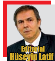
Editorial Hüseyin Latif

Du 1 er au 6 juin dernier, à Babiâli, on a organisé le festival de la presse. Des dizaines de milliers de visiteurs y ont parlé de la presse turque, en participant à diverses activités.