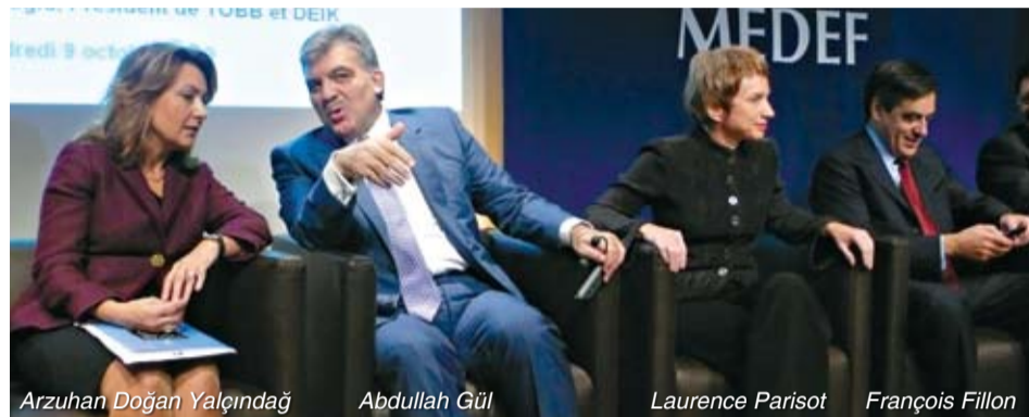
Arzuhan Doğan Yalçındağ Abdullah Gül Laurence Parisot François Fillon

notamment en ce qui concerne les véhicules électriques qui seront conçus en Turquie. Il a ensuite proposé que la Turquie devienne « un centre logistique international », notamment dans le cadre d'une coopération pour les investissements dans les pays voisins turcophones. Le marché turc ne s'arrête d'ailleurs pas aux 71 millions d'habitants de la République de Turquie. Il englobe les 300 millions de Turcophones que compte la région, où se sont déjà installées quelque quinze mille entreprises turques.