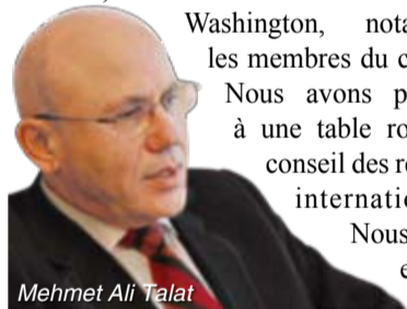
Mehmet Ali Talat

D'abord, nous avons eu divers contacts à Washington, notamment les membres du congrès. Nous avons participé à une table ronde au conseil des relations internationales. Nous avons eu l'oc-